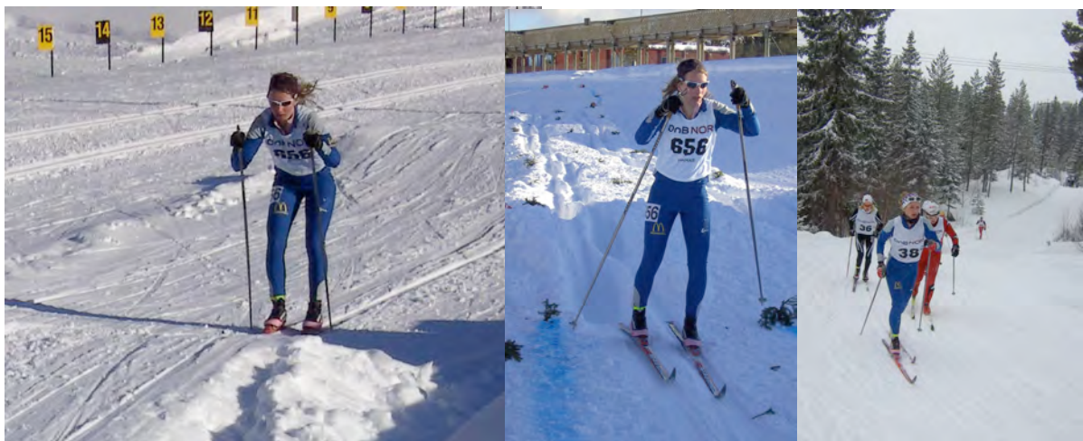
Skiicross og stafett