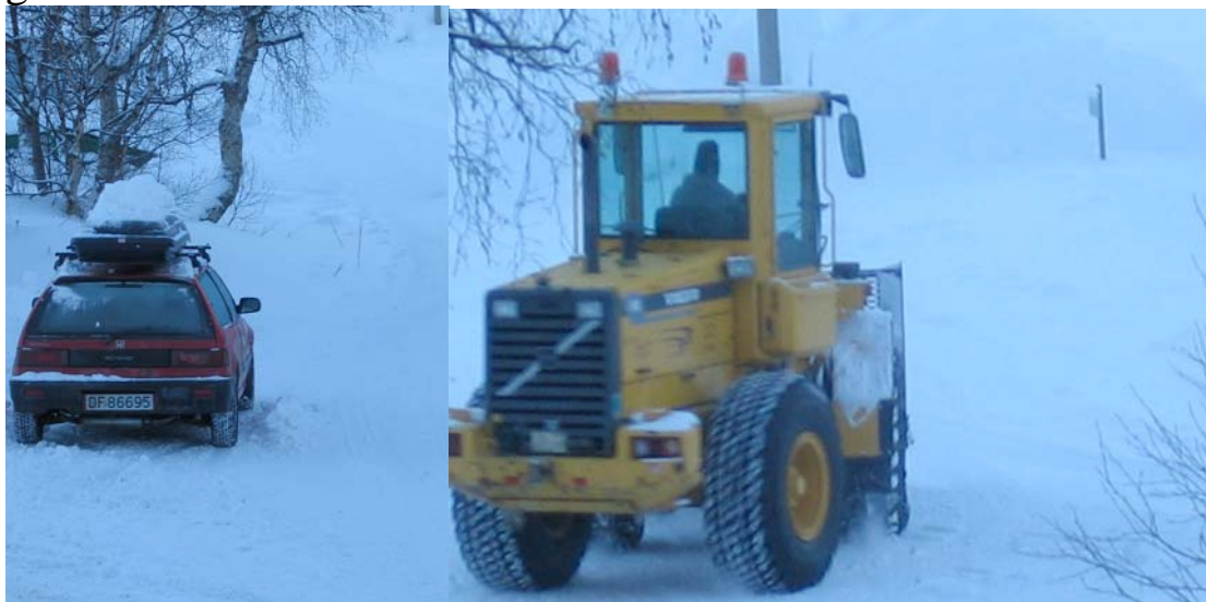
Slik gjør man i Sverige når bilene står feilparkert. Stakkars Civic.